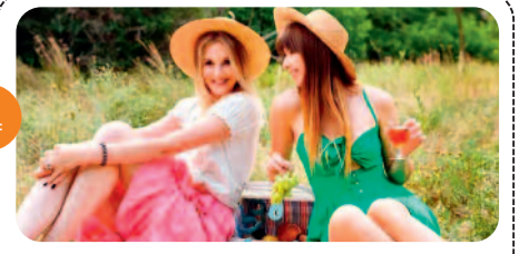
समर में अपने स्टाइल से बिखेरें...