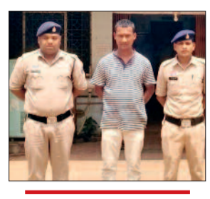
नेवई पुलिस ने की कार्रवाई, नकदी सहित सट्टा पट्टी जब्त

नेवई थाना पुलिस ने मंगल बाजार टंकी मरोदा इलाके में सट्टा संचालित करते एक आरोपी को गिरफ्तार किया है। आरोपी के खिलाफ छत्तीसगढ़ सार्वजनिक जुआ प्रतिबंध अधिनियम 2022 के तहत कार्रवाई की गई।